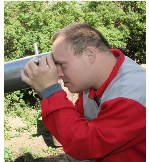
Zážitková zahrada v Emanuelu

e-mail: emanuel.boskovice@blansko.charita.cz