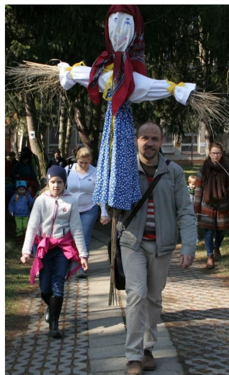
Vítání jara v Klubu Ratolest